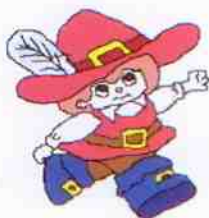
Infantário 'O Polegarzinho'